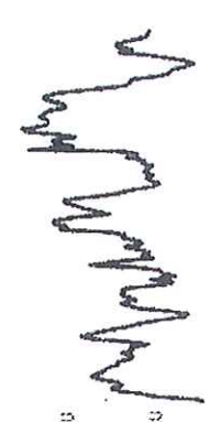
16:30 Jan 16:30 Jul 16:30 Sep 16:30 Nov

*NYMEX RBOB (unleaded gasoline) (16:30 page 231)